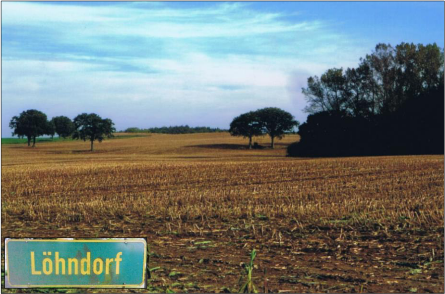
Rechts die Eiderquelle in den Waldstücken