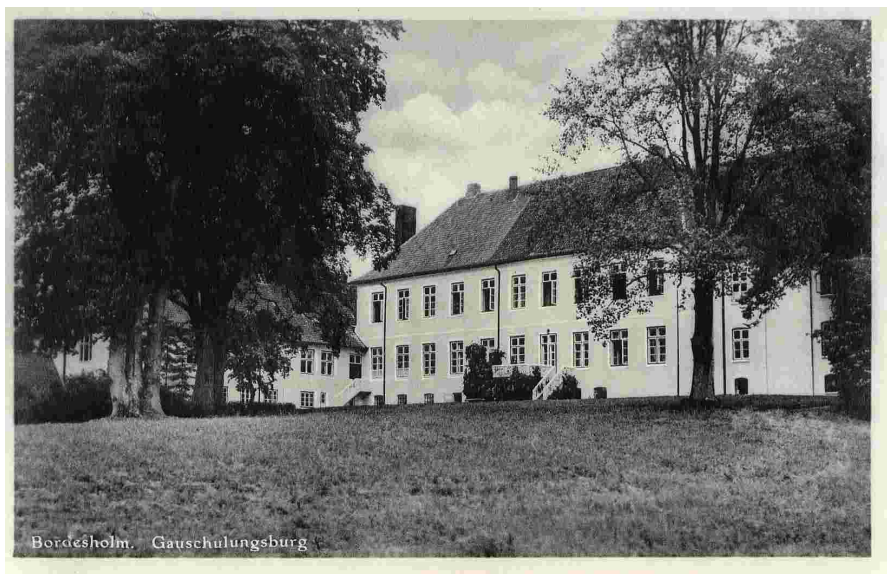
Die NS-Gauführerschule 1937 im Gebäude des heutigen Klosterstifts an der Klosterkirche in Bordesholm.