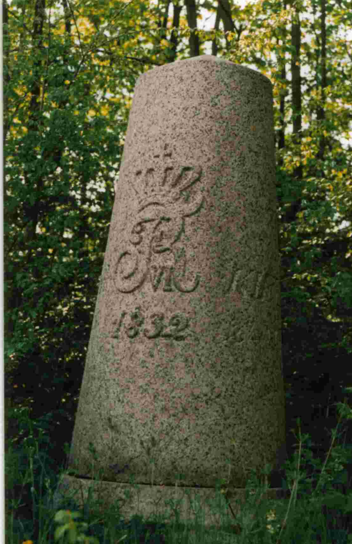
Meilenstein Schmalstede. Gegenüber Dibberns Gasthof.