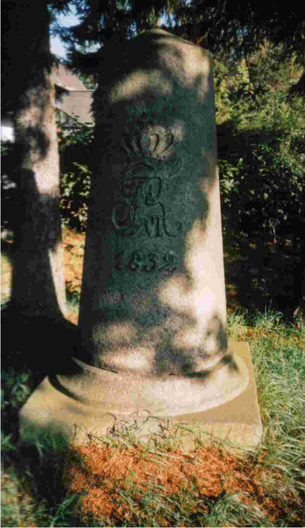
Meilenstein Einfeld. Einfelder Schanze.