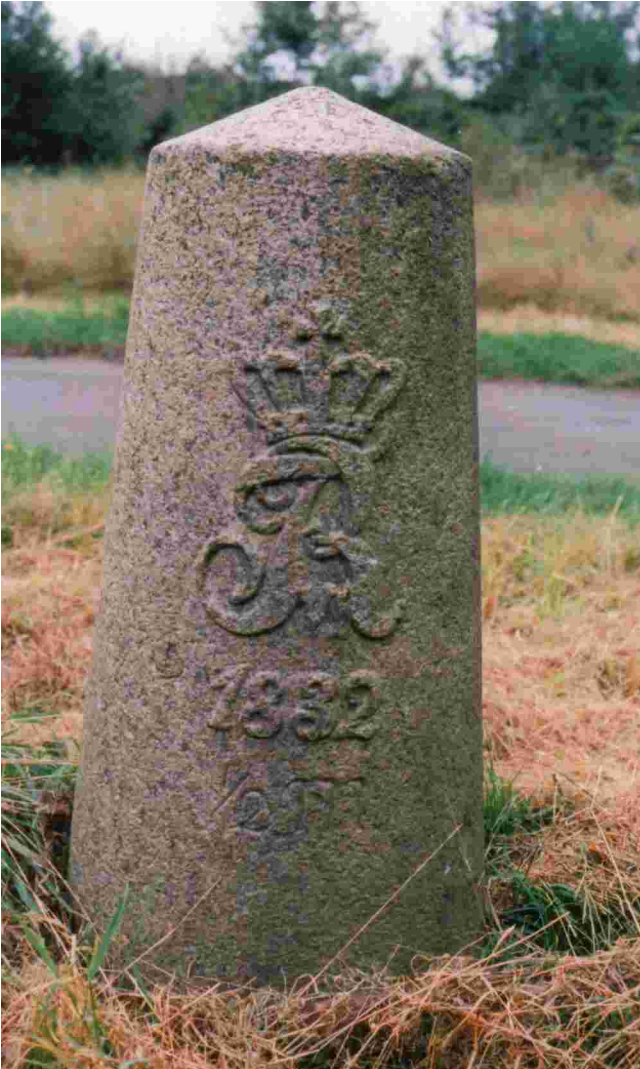
Halbmeilenstein Grevenkrug. Blumenthaler Berg.