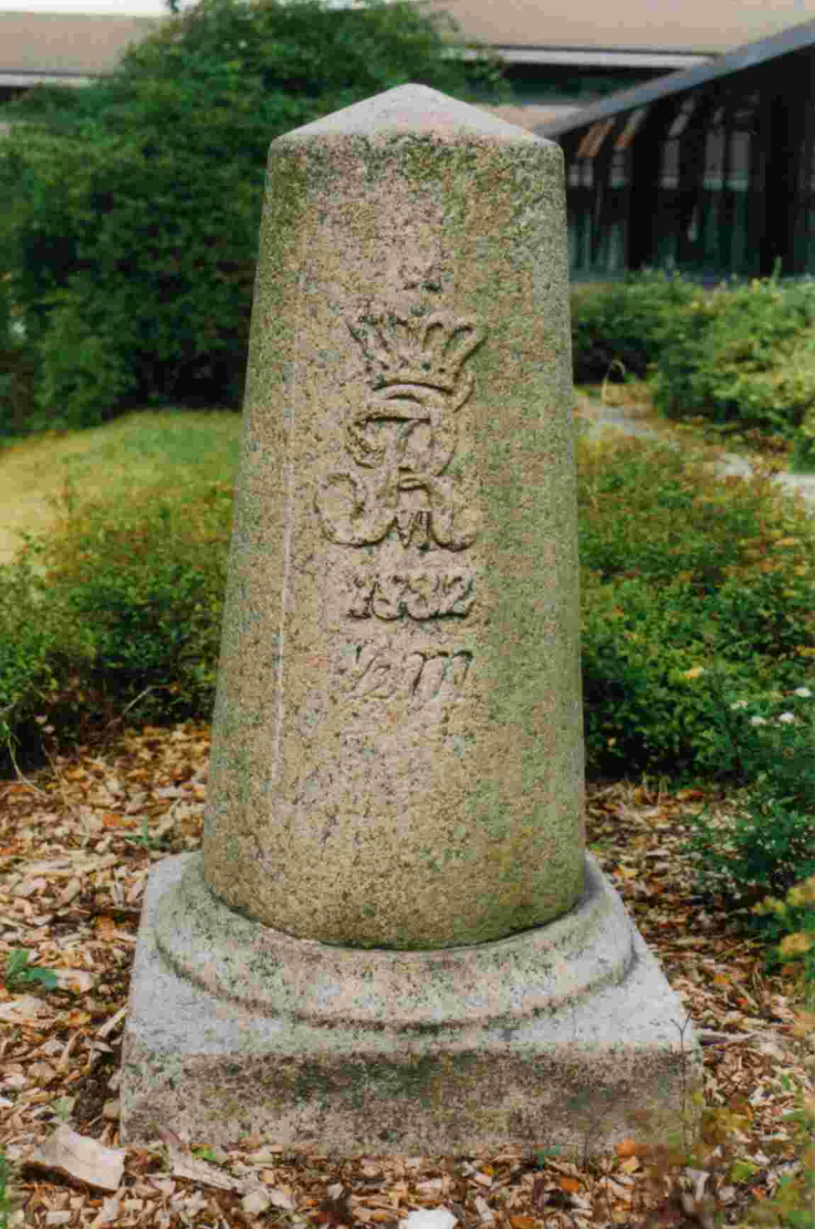
Halbmeilenstein Molfsee. An der Amtsverwaltung.