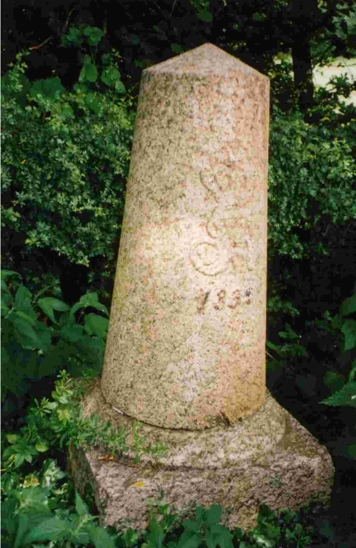
Halbmeilenstein Bordesholm. Höhe Eckholm.