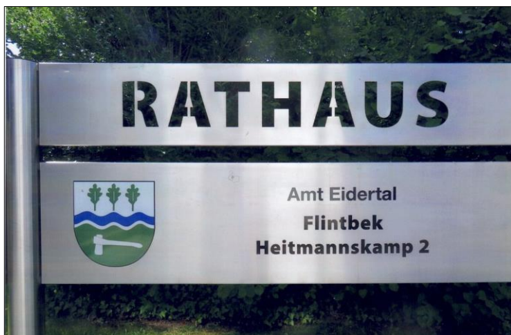
Das neue Schild „Amt Eidertal“ am Flintbeker Rathaus