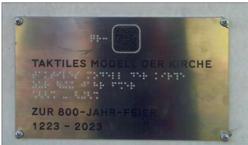
Modell der Kirche einschl. taktilem Modell, gestiftet zur 800-Jahr-Feier