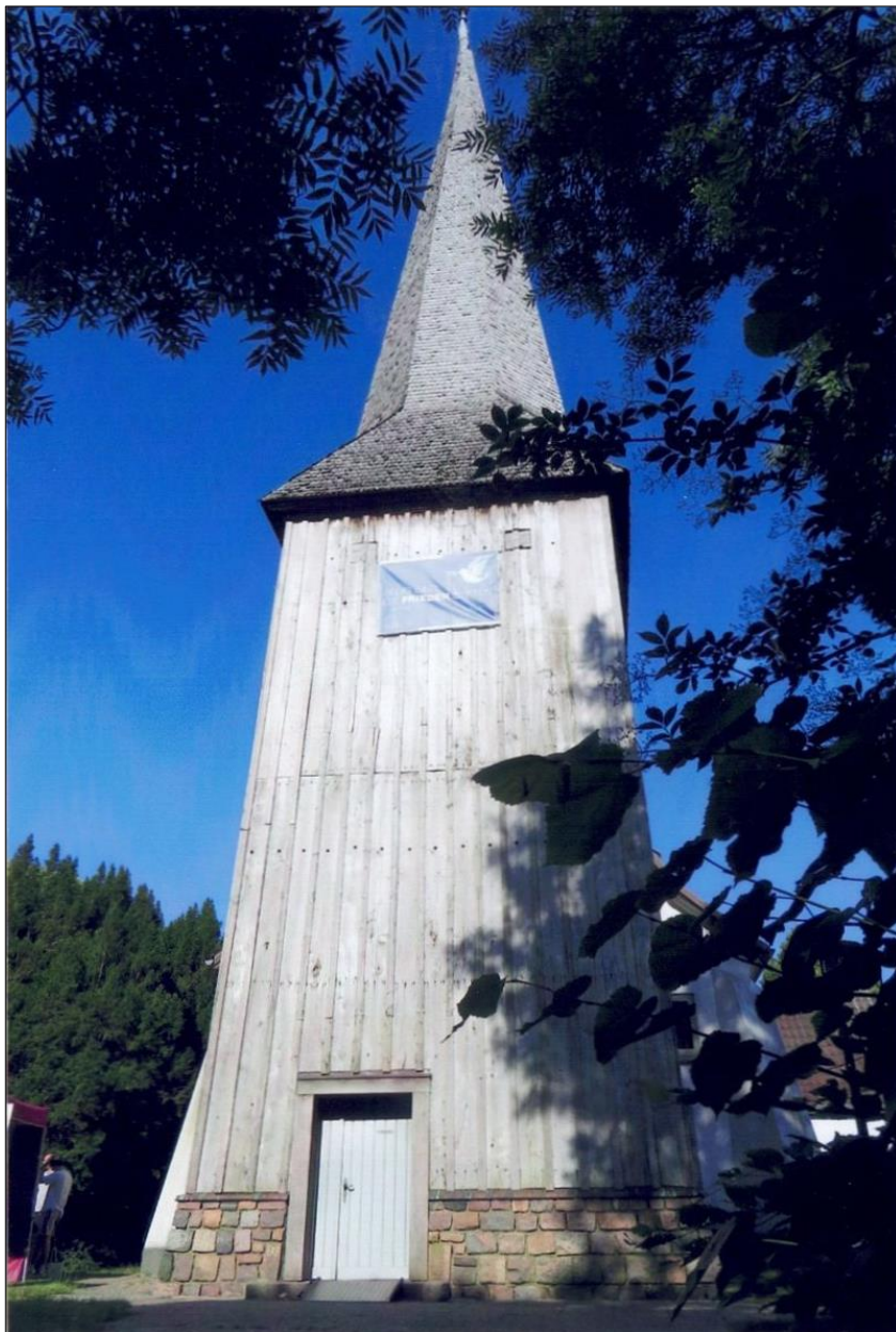
Der Turm der Flintbeker Kirche am Tag des Festaktes