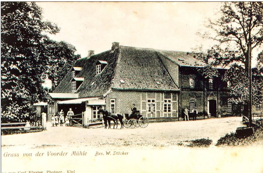
Wassermühle Voorde, Straßenansicht