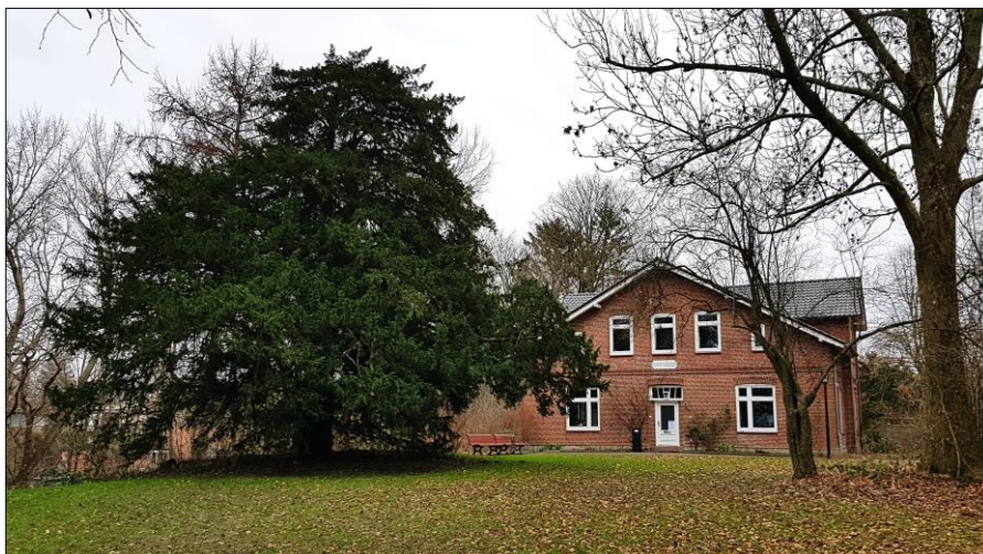
Eibe im Pastorats-Garten

Im Pastorats-Garten steht noch heute eine Eibe, die als 1000-jährige Eibe bezeichnet wird. Sie stand bereits vor dem Bau der Kirche, hat aber wohl nur ein Alter von ca. 900 Jahren.