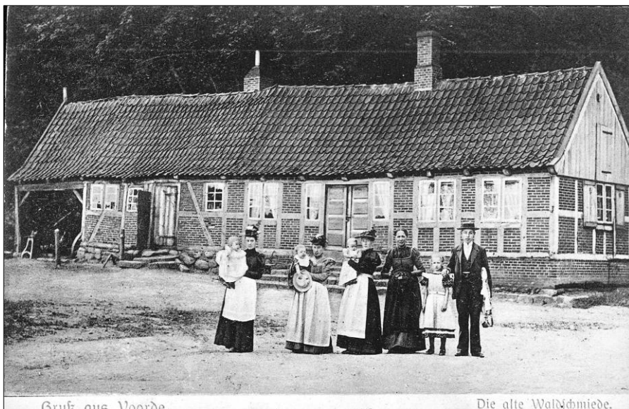
Waldschmiede in Voorde

Nachdem der Mühlenzwang 1853 aufgehoben wurde und auch in anderen Dörfern Mühlen unterhalten wurden, verlor die Voorde Mühle an Bedeutung. Die Schmiede wurde mit der Schankgenehmigung verkauft und Anfang des 20. Jahrhunderts bauten Flintbeker Bürger an Stelle der Schmiede eine Gastwirtschaft das „Eiderschlößchen“ mit Tanzsaal und Kegelbahn.