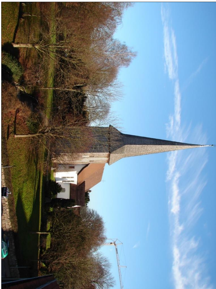
Kirche Fimmbek heute (Foto: Wiebke Stöllgen, 2007)