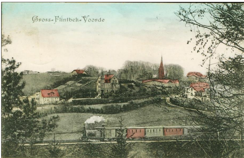
Eisenbahn zwischen Voorde und Groß-Flintbek

Der Kirchenstieg zwischen diesen Gemeinden führte an der Haltestelle vorbei. Die Fuhrwerke der Flintbeker Bauern mussten diesen Weg nutzen, um zur Voorder Wassermühle zu gelangen.