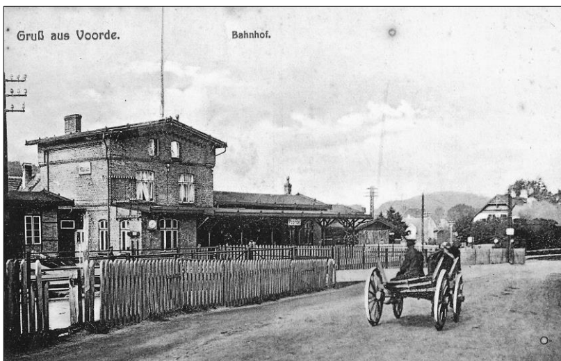
Bahnhof Voorde