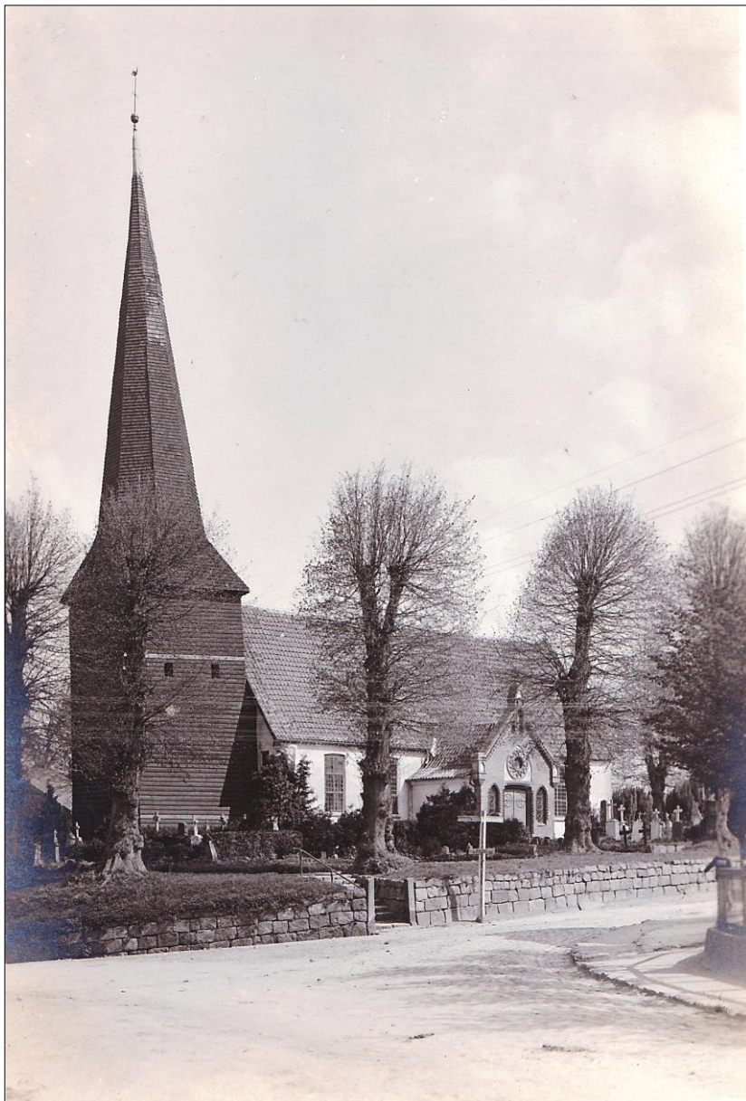
Kirche Flintbek ca. 1930