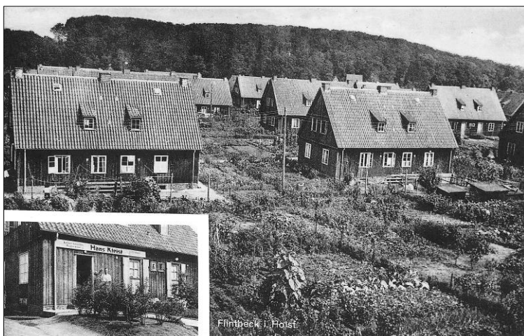
Finnhäuser in Voorde

Nach dem Krieg kamen viele Flüchtlinge ins Dorf. Zum Teil blieben sie in Flintbek und veränderten das Dorf abermals. Inzwischen gibt es nur noch wenige aktive Landwirte im Ort. Nach dem Krieg begann eine Welle von Aussiedlungen. Inzwischen ist Flintbek ein großstädtisch geprägter Ort mit vielen modernen Bauten und vielfältigem Gewerbe. Die 800 Jahre kann man dem Dorf nicht ansehen.