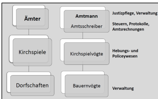
Abb. 2: Struktur und Zuständigkeiten der holsteinischen Lokalverwaltung

Im Herzogtum Holstein waren die Ämter in Kirchspiele und schließlich in Dorfschaften unterteilt (siehe Abbildung 2). Auf der untersten Stufe der Amtsverwaltung standen die Bauernvögte. Sie waren Verwalter ihrer Dorfschaft. Auf mittlerer Ebene standen die Kirchspielvögte, sie wurden im Steuer- und Polizeiwesen eingesetzt. Die