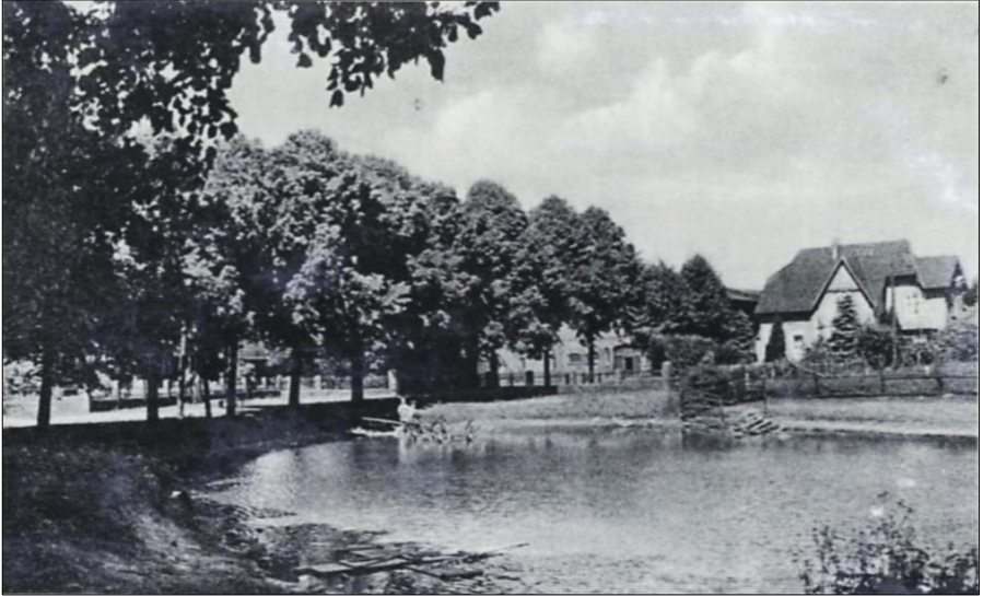
Dorfansicht mit Teich