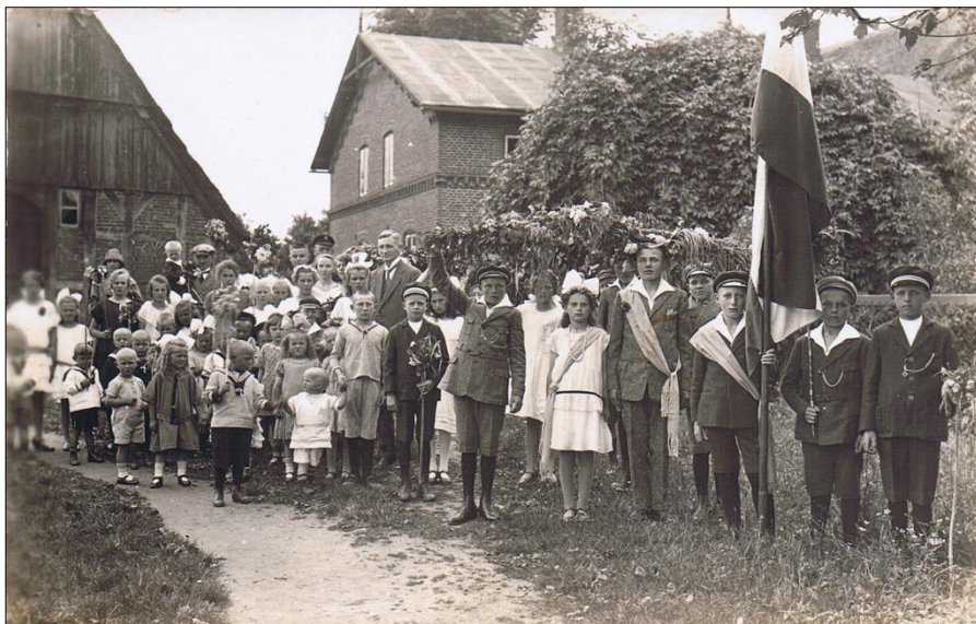
1926 auf dem Hof Staben (heute: Teegen)

Am 22. Dez. wurde wieder eine Weihnachtsfeier veranstaltet, die großen Ereignisse der Zeit standen bei dieser Feier im Vordergrund.