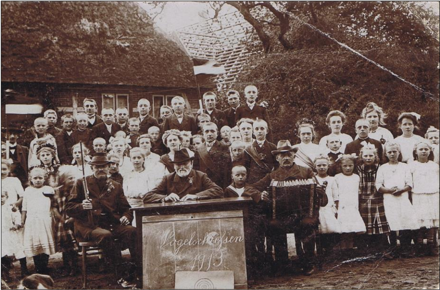
Vogelschießen in Loop 1913; links die alte Schule, in der Mitte der Dachstuhl der neuen Schule, die bis zur Auflösung 1972 als Schulgebäude diente.