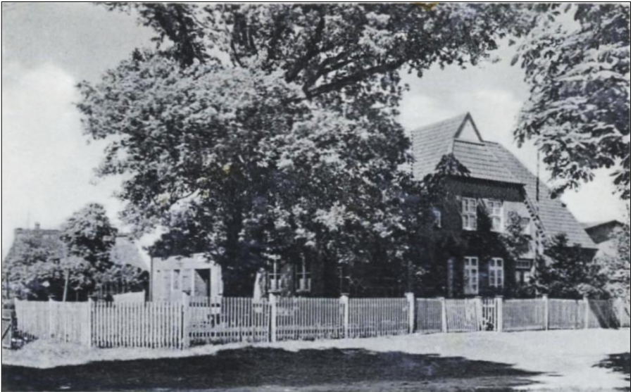
Die Dorfschule von Loop um 1930