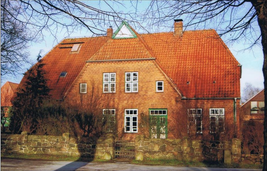
Die Dorfschule von Loop 2014

Der Spielplatz war bisher der Dorfplatz vor der Schule gewesen, am kleinen Dorfteich gelegen, von Linden und uralten Eichen beschattet, gewiß ein idealer Spielplatz für die Jugend. Da er aber durch einen Weg von der Schule getrennt war, beschloß man ihn aufzuheben und das Stück Gartenland an der Westseite als Spielplatz herzurichten. Der Verlust an Gartenland wurde dadurch aufgehoben, daß ein Stück an dem baadeschen Grundstück, hinter dem Schulgrundstück wieder erworben wurde.