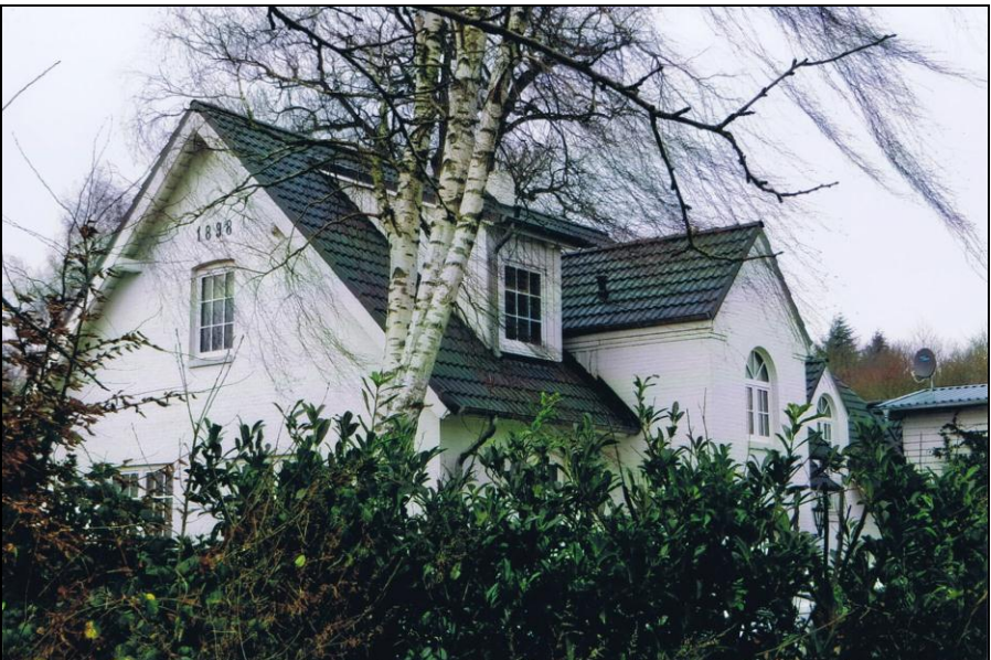
Forsthaus Rumohr von 1898, heute private Nutzung