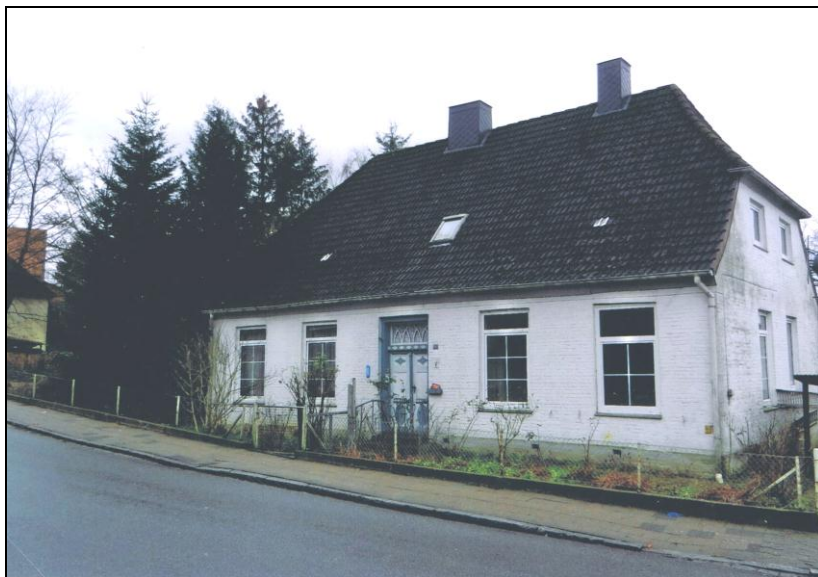
Heute: Rosenberg 16