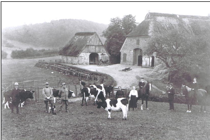
Die Holzvogtstelle in Brüggerholz in den 1920-er Jahren