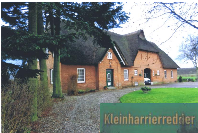
Die Försterei Kleinharrie