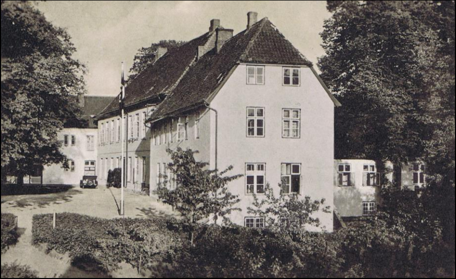
Postkarte 1935: Gauführerschule – heute Klosterstift Im Westflügel war von 1867 - 1908 die Oberförsterei Bordesholm untergebracht

Folgende unterstellte Dienststellen überwachte der Forstgutsbezirk Bordesholm: