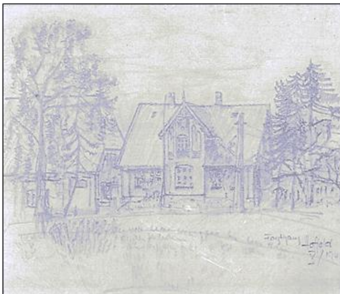
Forsthaus Hoffeld mit Scheune, Bleistiftzeichnung von Kurt Zywiets, 1946 (einquartierter ostpreußischer Flüchtling)