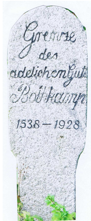
Die Grenzsteine des Amtes Bordesholm und der Gutes Bothkamp