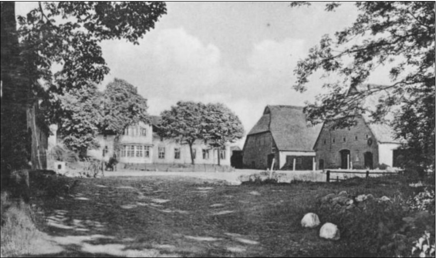
Herrenhaus Ovendorf (Foto: Gumlich, ca.1930)

Am südöstlichen Zipfel des Amtes Bordesholm liegt die Siedlung Ovendorf mit dem Ovendorfer Redder. Entlang der heutigen L 67 zwischen dem ehemaligen Wirtshaus „Brauner Hirsch“ und Leckerhölken stehen vereinzelt Gehöfte, Wohnkaten und der Hof Ovendorf.