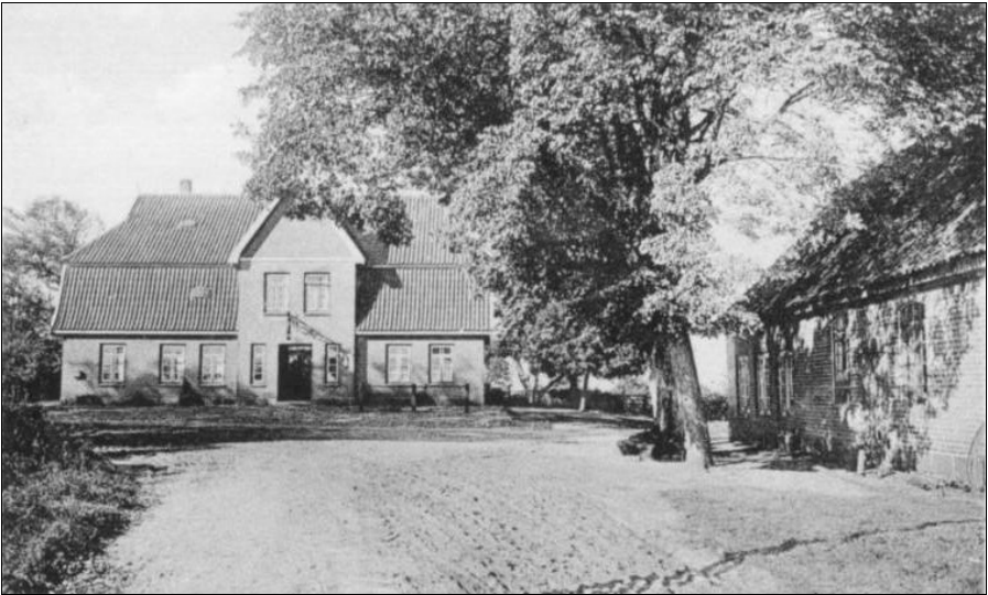
Leckerhölken, (Foto: Gumlich, ca. 1930)

Am „Brauner Hirsch“ prangt noch das Reklameschild.