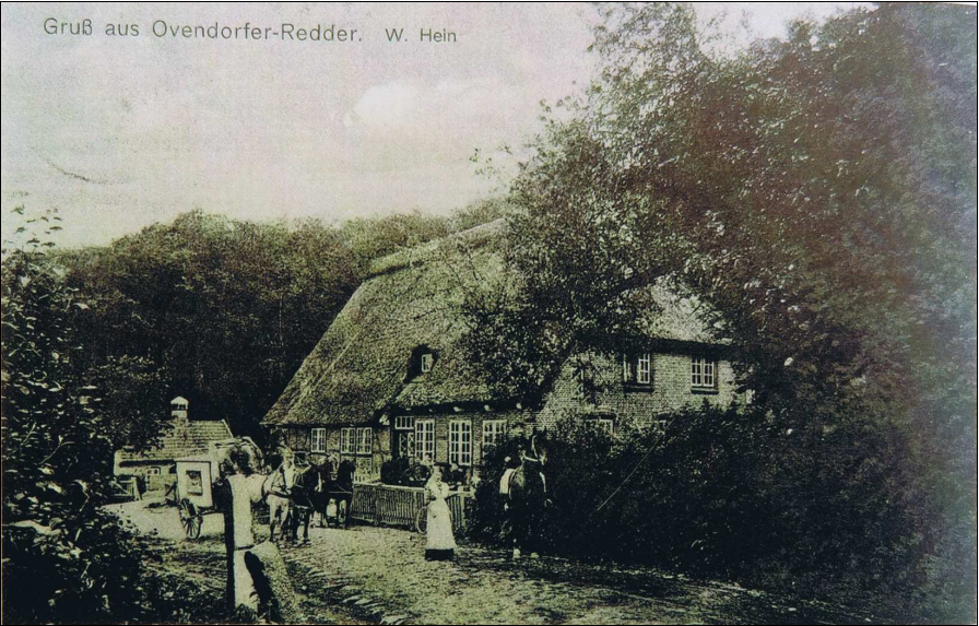
Ovendorfer Redder: Buchenwald zwischen Klasterteich und Heickenteich. Grenzsteine des Amtes Bordesholm und des Gutes Bothkamp an der Preetzer Landstraße 1913

Fast genau 100 Jahre später finden wir folgenden Zustand: