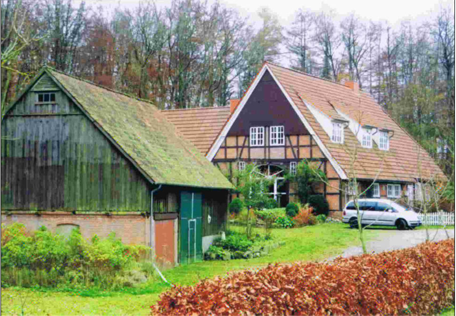
Ehemalige Hofstelle und Gastwirtschaft gut 100 Jahre später

Der Grenzstein „Amt Bordesholm“ hat seinen Standort an der heutigen L 67 kaum verändert, während der Stein mit der Aufschrift „Gut Bothkamp“ rund 500 m in Richtung Leckerhölken versetzt worden ist. Der Stein „Amt Bordesholm“ wurde Mitte des 19. Jahrhunderts eingegraben. Das Amt bestand bis 1867 und ging dann in den neugegründeten preußischen Landkreis Kiel - später Bordesholm - auf.