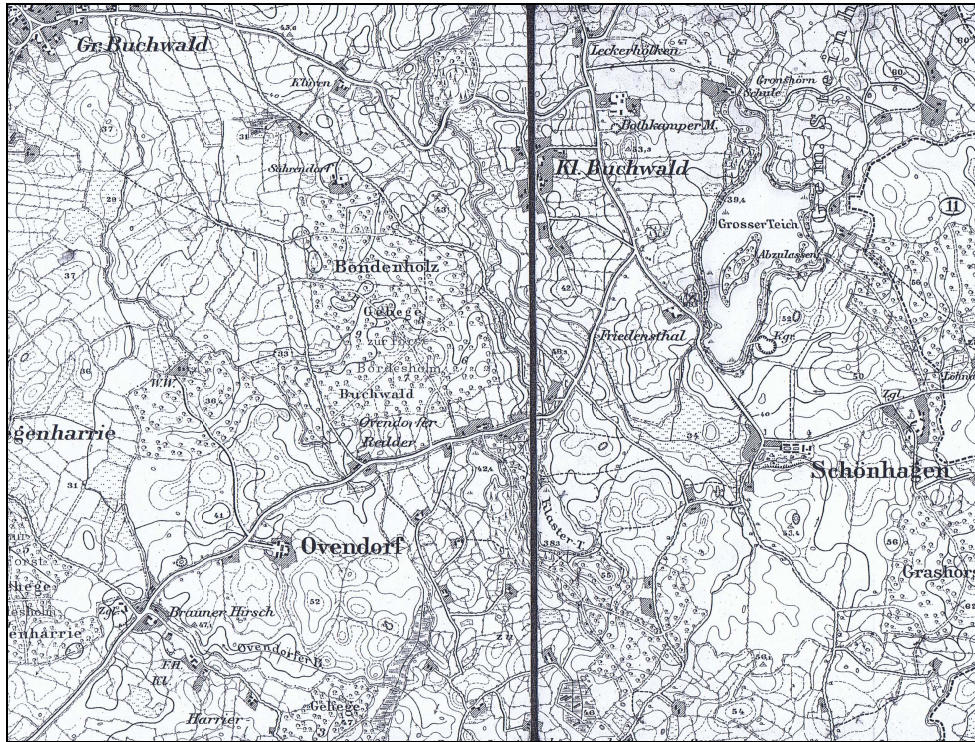
Karte Brügg – Königl. Landesaufnahme 1877, Straßen-Nachträge 1906 Dieser Kartenausschnitt und die Postkarte von 1913 sind in etwa zeitgleich und dokumentieren somit den damaligen Zustand. Der Hof Ovendorf war bis 1928 noch selbständiger Gutsbezirk.