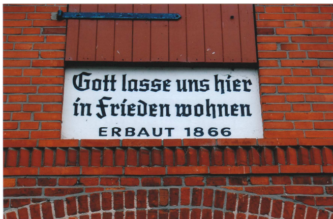
Gott lasse uns hier in Frieden wohnen Erbaut 1866