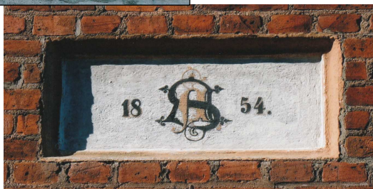
Inschrift über der Grootdör: 18 S 54