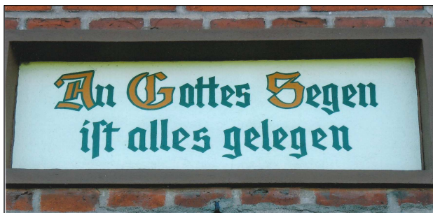
An Gottes Segen ist alles gelegen