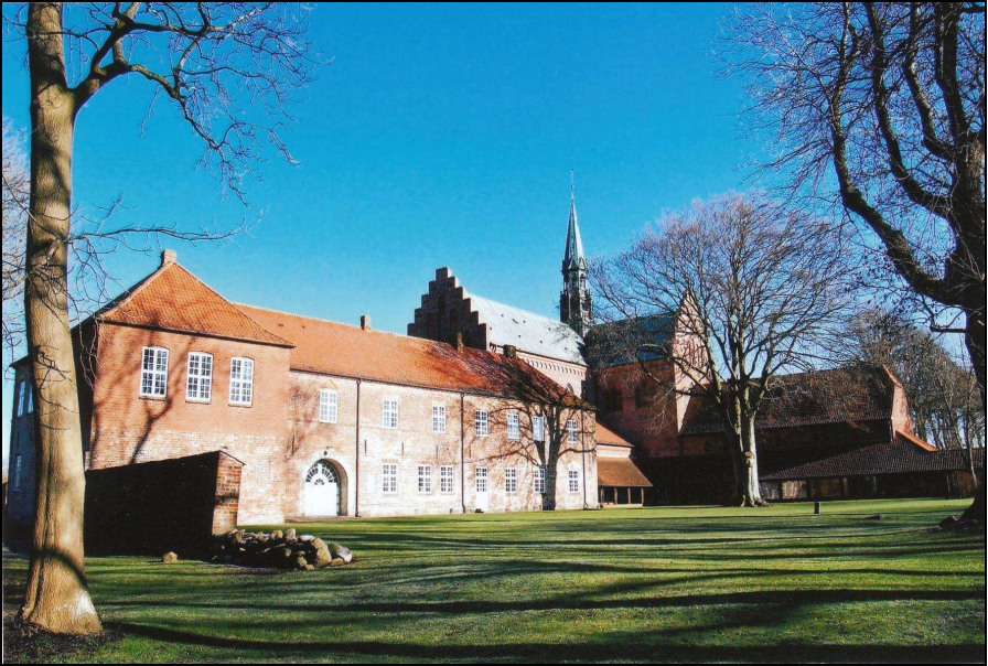
Kirche und Schloß Lügumkloster Angebaut liegt der Renaissance-Bau des Herzog Adolf von Gottorf von 1585 und diente als Jagdschloss. Die Kirche wurde 1225 - 1325 im spätromanischen Baustil errichtet. Der erste Klosterbau wurde durch Brand zerstört.