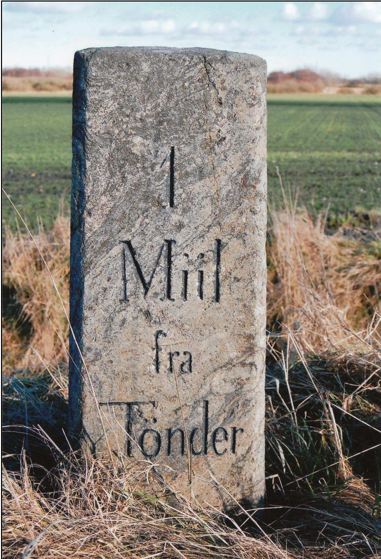
„1 Meile von Tønder“ Meilenstein an der N 11 zwischen Søelsted und Abild