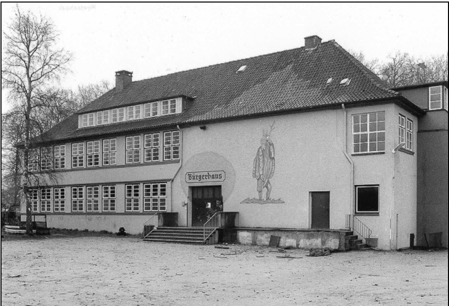
Das Bordesholmer Bürgerhaus am Wildhof im aktuellen Zustand