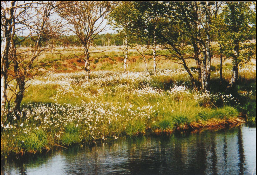
Wollgräser im Moor

schaftsteilen des Dosenmoors keimte wieder Hoffnung auf. Es bedurfte jedoch noch weiterer Protestschreiben und Pressekampagnen, bis endlich 1976 der maschinelle Torfabbau durch Erlass des MELF verboten und 1977 dann endgültig eingestellt wurde. 1979/80 kauften die Stiftung Naturschutz S.-H. und das Forstamt Neumünster erste Flächen im Dosenmoor an. Mit der Planierung und Abdichtung der zusammenhängenden industriellen Abtorfungsfläche im südlichen Zentralbereich begannen dann auch 1978/79 die ersten Regenerationsarbeiten. Das Konzept für die Regeneration des Dosenmoors wurde hauptsächlich vom Landesamt für Natur und Umwelt (LANU) entwickelt. Ein wesentliches Ziel des Konzeptes war zunächst, das Regenwasser zurückzuhalten und bis an die Oberfläche des Moores aufzustauen, um auf diese Weise den charakteristischen Pflanzen dieses Lebensraumes eine Wiederbesiedelung zu ermöglichen und mit Hilfe der Torfmoose und Wollgräser das Moorwachstum wieder in Gang zu setzen.