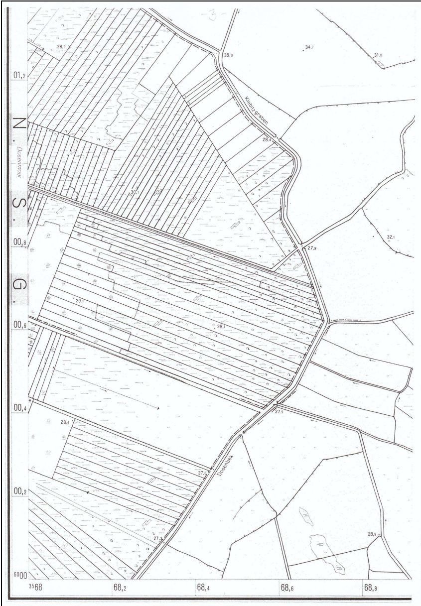
Beispiel der Moorparzellierung