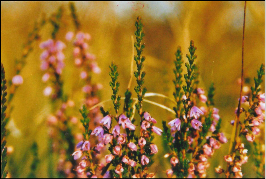
Moorheide im Dosenmoor

den NABU Neumünster war die Kopfbaumpflege (Stutzung) von etwa 30 Weiden am Rande des Dosenmoors in Neumünster-Einfeld im Februar 1984 und Oktober 1993.