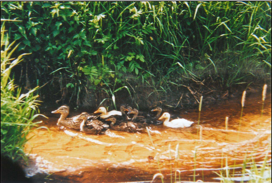
Enten in den Moorgräben

Aufgrund seiner vielfältigen Kleinlebensräume beherbergt das Dosenmoor auch eine artenreiche Tierwelt. Besonders reichhaltig ist die Insektenfauna vertreten. So wurden im Dosenmoor 238 Käfer-, 135 Schmetterlings-, 15 Libellen-, 11 Heuschrecken- und 68 Zweiflügler-Arten nachgewiesen. Auch die Spinnen gehören mit über 200 Arten zu den am stärksten vertretenen Tiergruppen. Aus der Welt der Reptilien kommen Kreuzotter, Ringelnatter, Bindschleiche und Waldeidechse und von den Amphibien der Gras-, Teich- und Moorfrosch sowie die Erdkröte vor. Die Säugetiere sind einschließlich der Nahrungsgäste mit knapp 20 Arten vorhanden. Zu den auffälligsten Tieren gehören neben den Libellen jedoch die Vögel.