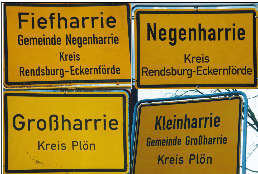
Die vier Harries, Fotos: Otto Faßbinder

Schon ab 1575 tauchen in den Verwaltungsverzeichnissen des damaligen Eigentümers aller Harries, dem alten Amt Bordesholm als Nachfolger des aufgelösten Klosters Bordesholm, die heute noch geltenden Dorfnamen mit dem einheitlichen -„harrie“ (anstelle des „harghe“) auf. 9 (Siehe nächstes Kapitel.)