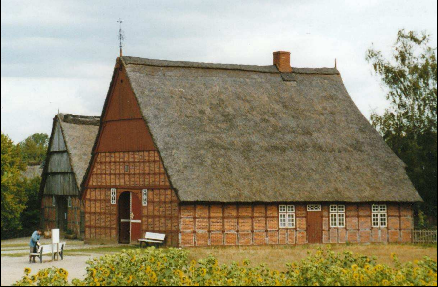
Hof Schurbohm (Großharrie) und Altenteilerkate Schnack (Negenharrie) im Museum im Molfsee, Foto: Rolf Pohlmeier