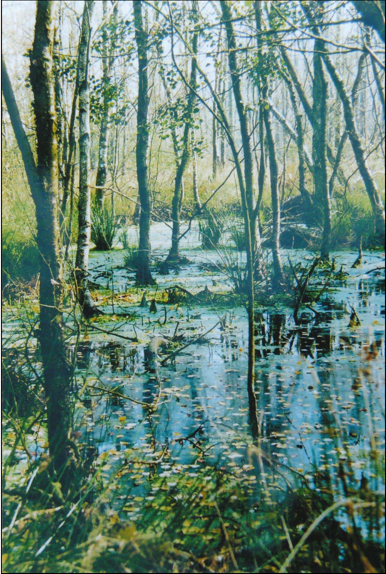
Schlamm, Sumpf ... das Moor