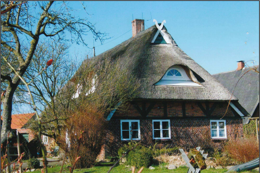
Dorfidylle: Die „Schusterkate“ - ältestes Gebäude in der Gemeinde Negenharrie

Ein erster Schritt zu getrennten Wegen und Orientierungen der vier Harrie - Dörfer war die 1737 vollzogene Änderung kirchlicher Zuständigkeit: Negen - und Fiefharrie wurden dem Kirchspiel Bordesholm zugeordnet, Groß - und Kleinharrie waren weiterhin nach Neumünster orientiert.