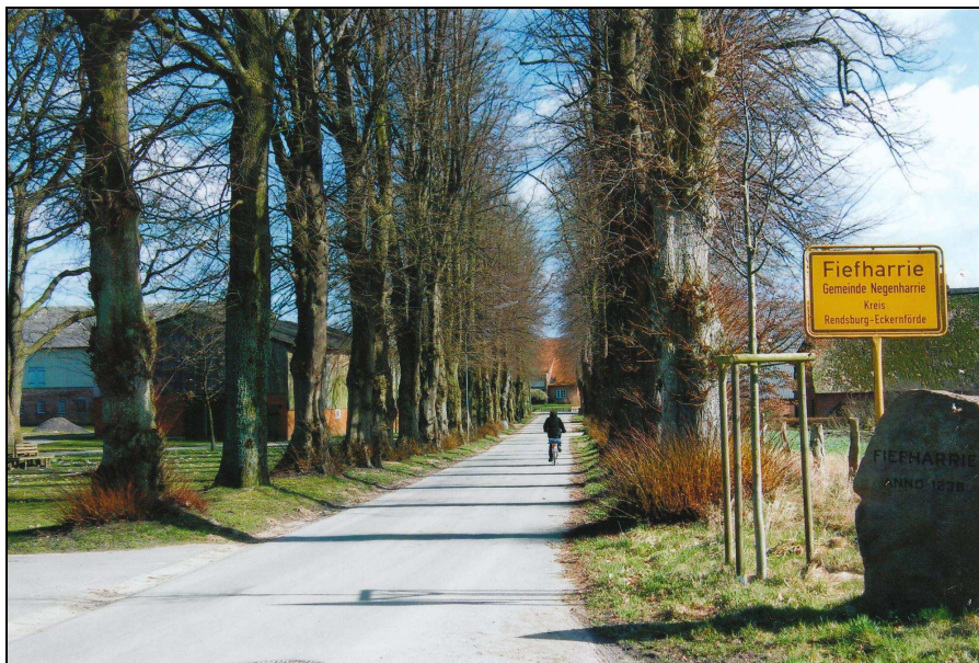
Fiefharrie - einst auch räumlich getrennt - heute Ortsteil