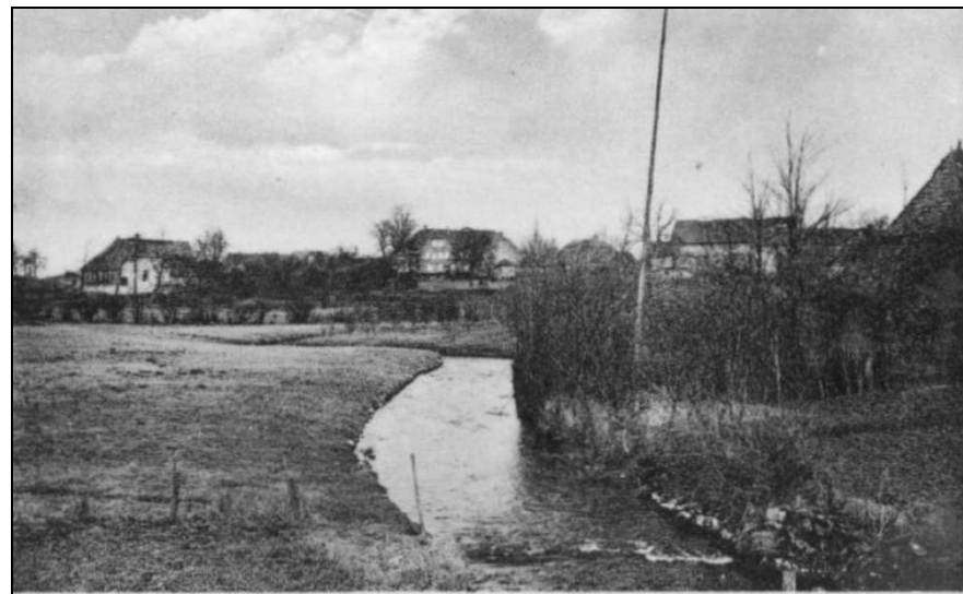
Brügge - Teilansicht mit Eiderlauf, im Hintergrund das Pastorat (ca. 1930)

[169] Brügge, 29. September: „Beim Gastwirt Delfs in Brügge explodierete während des Dreschens plötzlich der Dampfkessel der Dampfdreschmaschine und das kochende Wasser spritzte 12 m weit über die Straße. Zum Glück waren keine Zuschauer zugegen, sodaß kein größeres Unglück entstehen konnte.“ (KNN vom 30.09.1906)