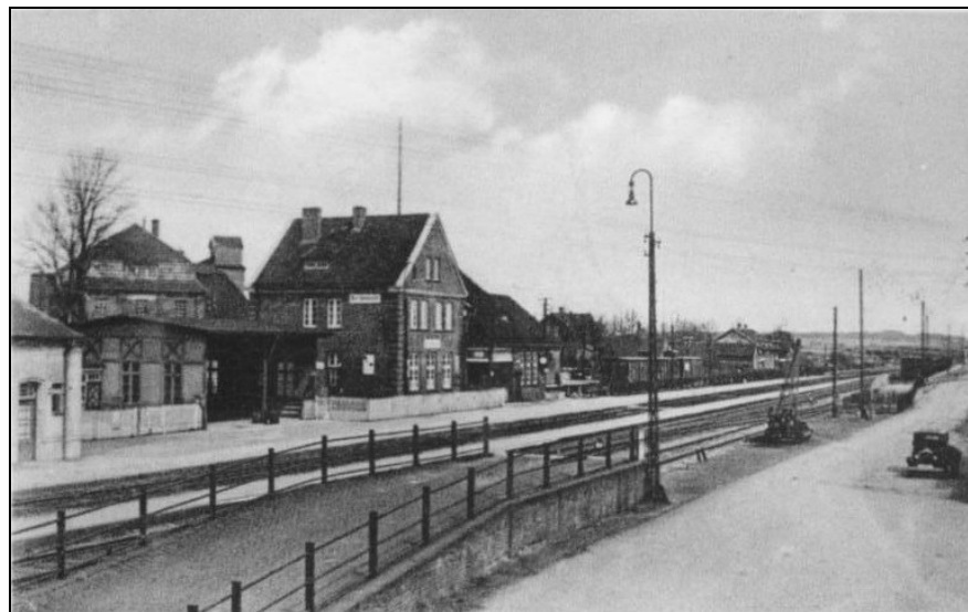
Bordesholmer Bahnhof