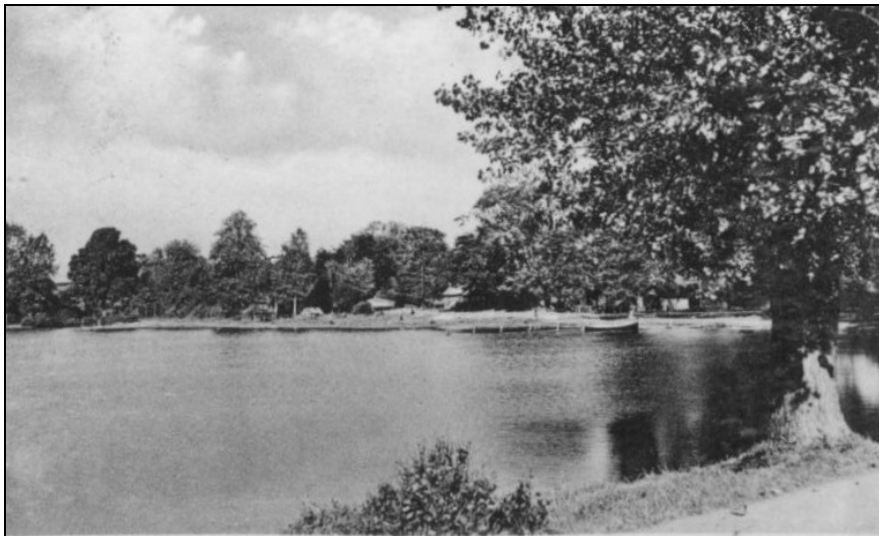
Mühbrook – Partie am Einfelder See