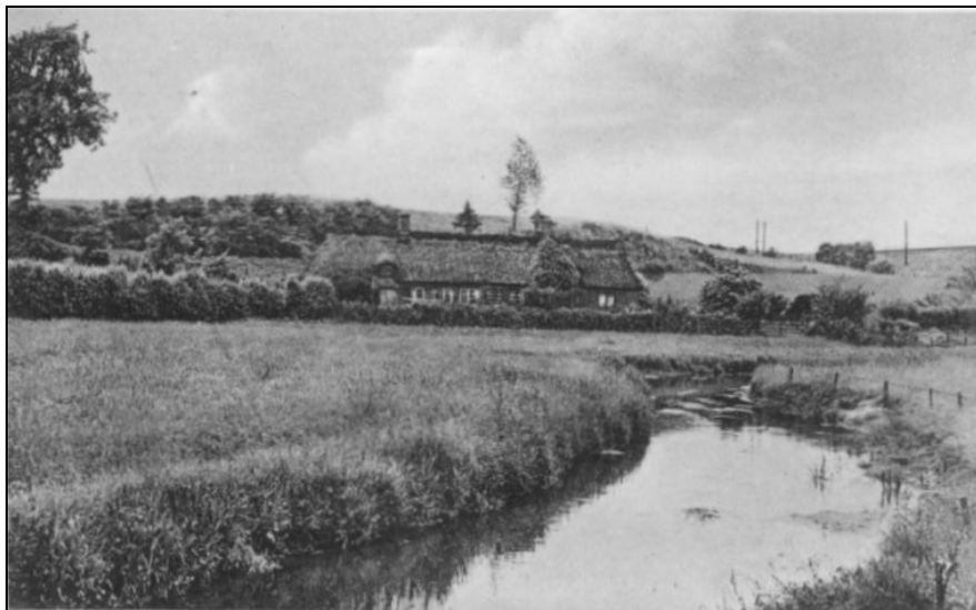
Reesdorf - Die Eider mit der Kommunkate