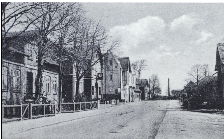
Bordesholm – Die Bahnhofstraße mit der Spar- und Leihkasse Bordesholm-Bahnhof