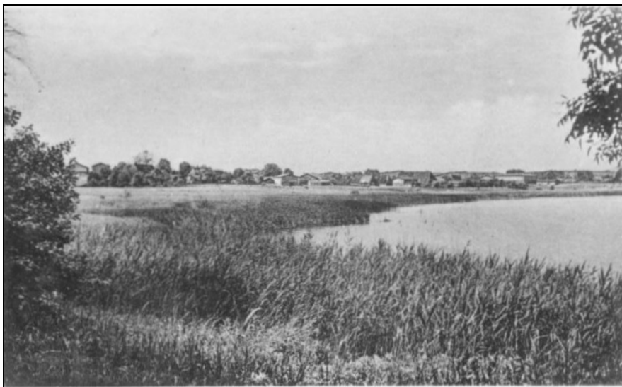
Bissee – Lage des Dorfes am Bothkamper See (Foto: Gumlich-Album, ca. 1930)

finden regelmäßig am Donnerstag abend im „Alten Haidkrug“ statt. Der Verein erfreut sich bereits einer recht stattlichen Mitgliederzahl und auch viele passive Mitglieder sind ihm beigetreten.“ (HC vom 08.04.1906)