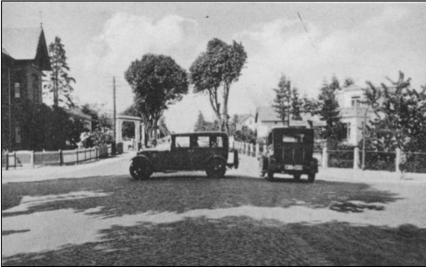
Die gefährlichste Straßenkreuzung Bordesholms, Hamburg-Kieler Chaussee und Holstenstraße