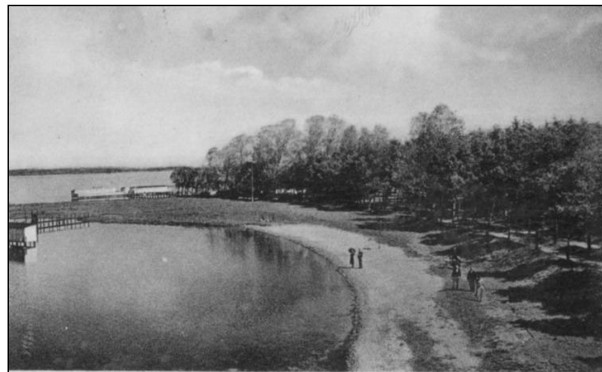
Einfeld – Birkenallee zur Strandhalle und Badeanstalt (ca. 1930)

folgende Damenschwimmen, das 8 Teilnehmerinnen fand, die die mittlere Strecke durchschwammen; nur zwei der Damen wurden unterwegs flau und mußten in die Begleitboote aufgenommen werden, die übrigen 6 durchschwammen sämtlich die Strecke. Auch das Wettrudern verlief ganz interessant. Von etwa 7 Uhr an konzertierte dann eine Abteilung der Kapelle unserer 163er im Gaedtkeschen Parkrestaurant und bei Beginn der Dunkelheit wurde am Strande und auf dem See ein prächtiges Feuerwerk abgebrannt. Schade, daß der Abend etwas kühl war und ein langes Sitzen im Freien nicht gestattete. Für die Tanzlustigen gab es schon von Nachmittag ab in H. Nagels Ballsaal Gelegenheit, Terpsichoren zu huldigen, wovon in so ausreichendem Maße Gebrauch gemacht wurde, daß der allerliebste Saal häufig gar nicht ausreichte zur Aufnahme all der Tanzverehrer. Auch im gemütlichen Nagel'schen Baderestaurant hatten sich nachmittags und abends viele Ausflügler niedergelassen, ebenso waren das Rix'sche „Bahnhofshotel“ und die Speck'sche Wirtschaft gut besucht, so daß „Der große Tag in Einfeld“ wohl alle zufriedengestellt hat.“ (HC vom 14.08.1906)