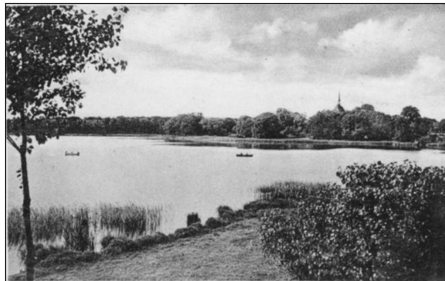
Blick auf den Bordesholmer See von der Seebadeanstalt aus gesehen

[091] Bordesholm, 12 Mai: „Aus Anlaß des zahlreichen Auftretens des Maikäfers fordert das Landratsamt die Ortspolizei des Kreises zur Vertilgung der Käfer auf. Aus Kreismitteln sind 300 M. zur Vertilgung der Käfer ausgesetzt. Unsere Gemeinde zahlt 20 Pf. pro Kilogramm Maikäfer.“ (KNN vom 13.05.1906)