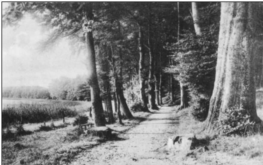
Bordesholm - Waldweg am See im Kleinen Wildhof (Foto: Gumlich-Album, ca. 1930)

[089] Bordesholm, 7. Mai: „In der Sitzung des Amtsausschusses wurde u. a. beschlossen, eine Polizeiverfügung zu erlassen, durch die das Radfahren in dem vielbesuchten „Wildhofe“ verboten wird.“ (KNN vom 08.05.1906)