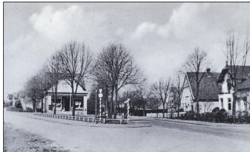
Bordesholm – Ecke Bahnhof- u. Eidersteder Straße (ca. 1930)

[208] Bordesholm, 17. Dezember: „Amtsvorsteher Deinert beabsichtigt, am Kreuzungspunkt der vom Bahnhof nach dem Ortsteil Eiderstede führenden Chaussee und des davon abzweigenden Fußweges ein größeres Warenhaus zu errichten. Der Bauplatz ist bereits abgesteckt. – Die s. Z. den hiesigen Lehrern bewilligte Gehaltserhöhung, zur Hauptsache die Lehrer des Ortsteils Eiderstede betreffend, mit rückwirkender Kraft vom 1. April d. J. ab ist von der Regierung bestätigt worden.“ (HC vom 18.12.1906)