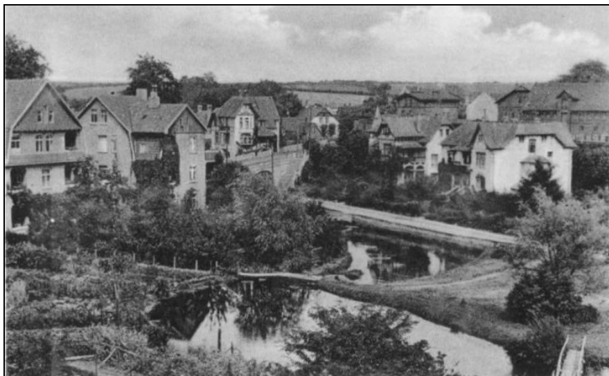
Voorde – Kolonie Lassen

[109] Voorde, 15. Juni: „Bauunternehmer Lassen-Voorde beabsichtigt außer der Erbauung von Villen die Errichtung eines Kurhotels mit großem Saal und 26 Logierzimmern in Voorde und hat bereits die Konzession beantragt.“ (KNN vom 16.06.1906)