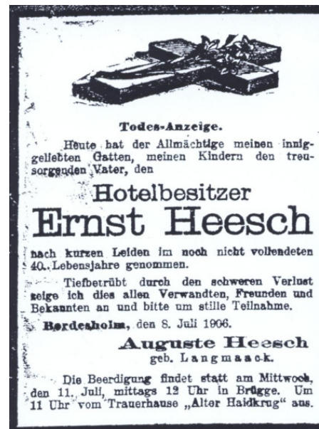
HC vom 10.07.1906