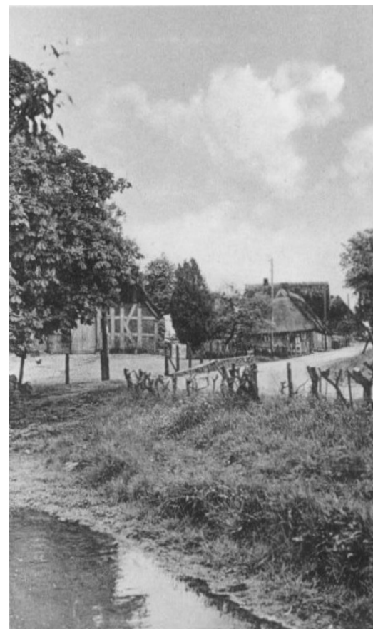
Mielkendorf – Teilansicht (Foto: Gumlich-Album, ca. 1930)

Kirchensteig. Der Kirchenvorstand hat nun bei dem Konsistorium dagegen Einspruch erhoben.“ (KNN vom 23.09.1906)