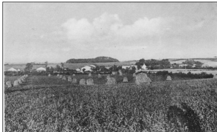
Schmalstede – Gesamtansicht des Dorfes, im Hintergrund das Eichholz

[163] Bordesholm, 25. September: Die Ober-Eider-Entwässerungs-Genossenschaft hat im Laufe des Sommers eine Regulierung des Ober-Eiderbettes hauptsächlich in den Feldmarken Schmalstede und Techelsdorf vorgenommen. Hierbei sind 5 größere Durchstiche in einer Gesamtlänge von 460 m gemacht worden, wobei ca. 5600 cbm Erde bewegt werden mußten, was einen Kostenaufwand von 5000 Mk. verursachte. Die weiten Wiesenabschnitte wurden mit den Besitzern getauscht, nur Hufner Brackers Wiese in der Gemarkung Schmalstede wurde fast in der Mitte durchschnitten. Hier war der Bau einer massiven Brücke über die Eider erforderlich. Bedauerlicherweise hat sich in dem neuen Bett bereits die Wasserpest eingemistet.“ (KNN vom 26.09.1906)